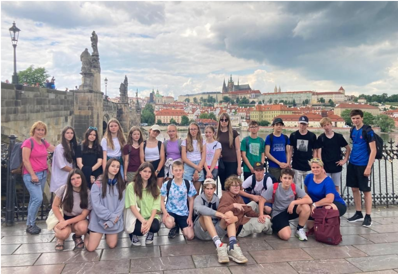
pohled z Prahy – výlet 8.B

ZŠ 8.května 63,787 01 Šumperk 2. číslo 2021/22 5 Kč