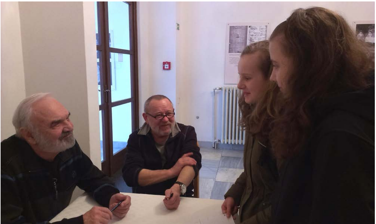
Redaktorky Alfonze v rozhovoru s panem Zdeňkem Svěrákem.

Výtěžek z prodeje bude použit na nákup knih do školní knihovny.