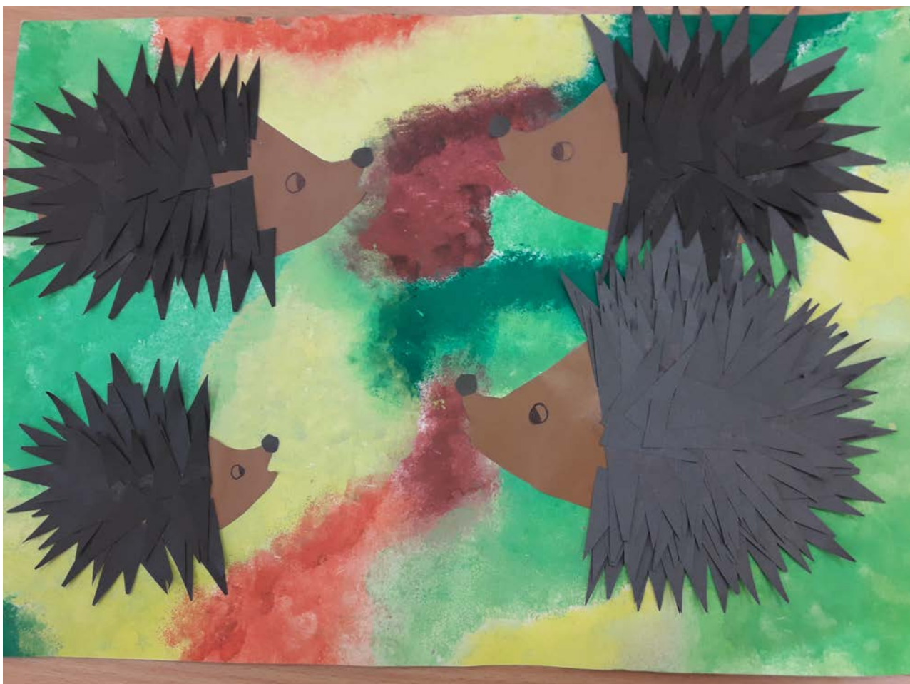
obrázek od Veroniky Hufové ze 4.B

Pravé přátelství je rostlinka, která roste pomalu, musí podstoupit a vydržet mnohé rány a nepřízně osudu, než si zaslouží své jméno.