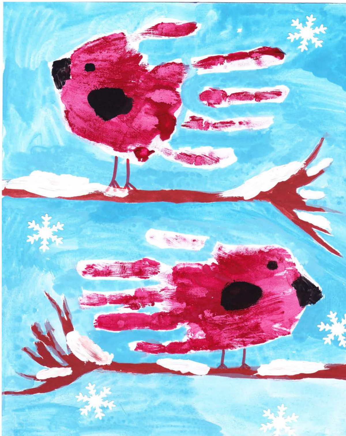
ALFONZ zima 2016