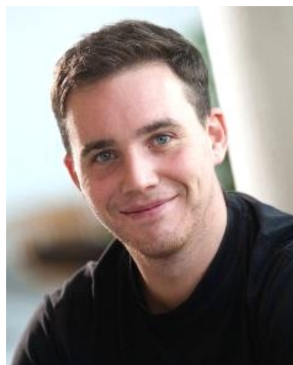
M.F., foto: google.cz

Dne 26.3. mu můžete při přímém televizním přenosu z Národního divadla držet pěsti !