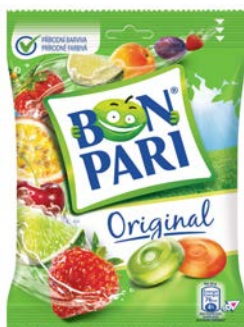
Bon Pari 3