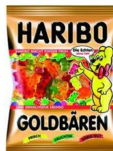
gumoví medvídci 6