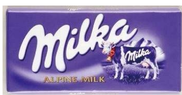
čokoláda Milka 2