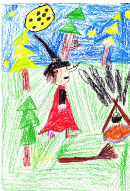
Matěj Janák (2.C) - obrázky k textu na s.11