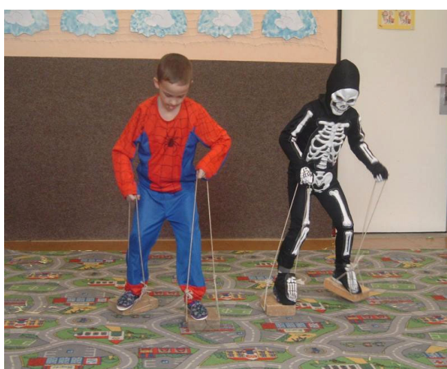
karneval ve školní družině