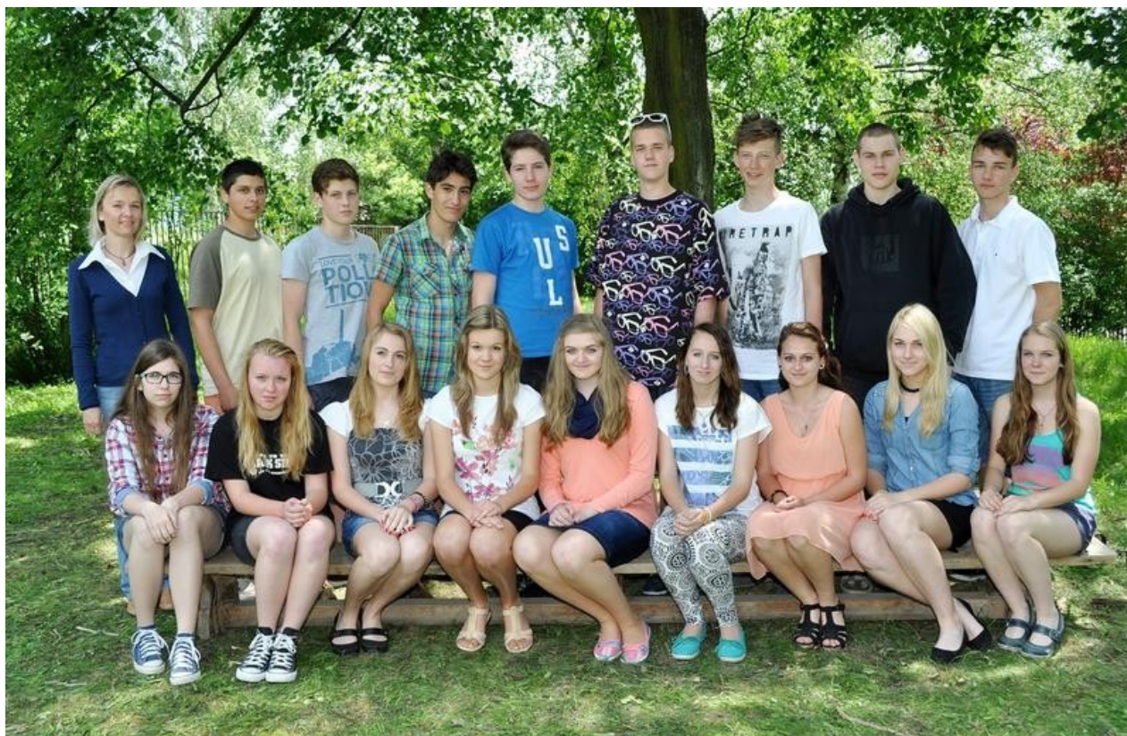
ZŠ Hluchák 2013 - 2014

Teď už opravdu přišel čas se po devíti letech rozloučit. Za naši třídu bych tedy chtěl říct to hlavní: DĚKUJEME!