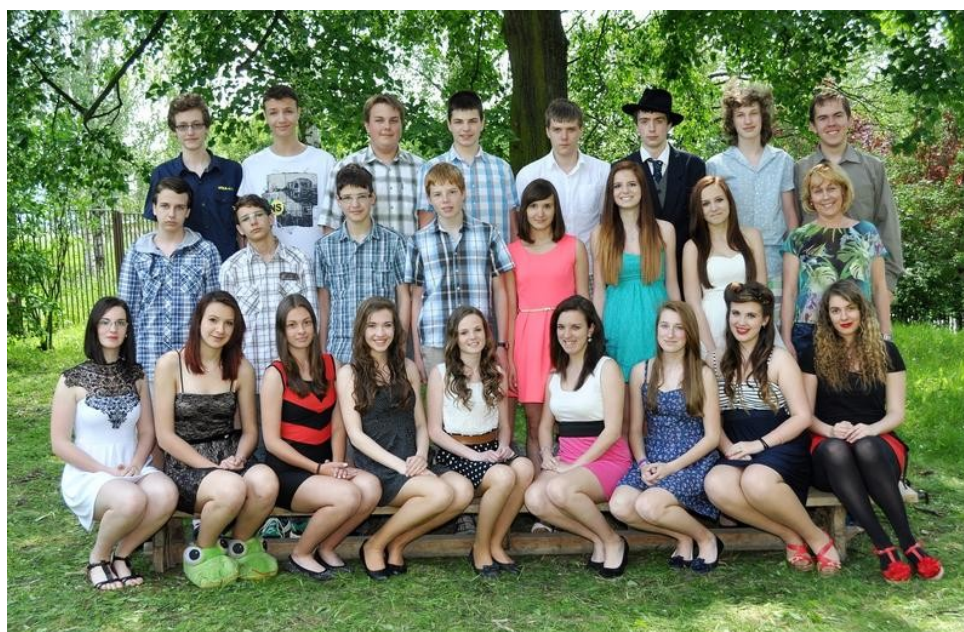
ZŠ Hluchák 2013 - 2014

Nakonec dovolte, abychom Vám, mladým sazenicím a stromkům, popřáli dobré počasí a kvalitní hlínu. A Vám, zahradníkům, pevnou ruku a chuť do práce!