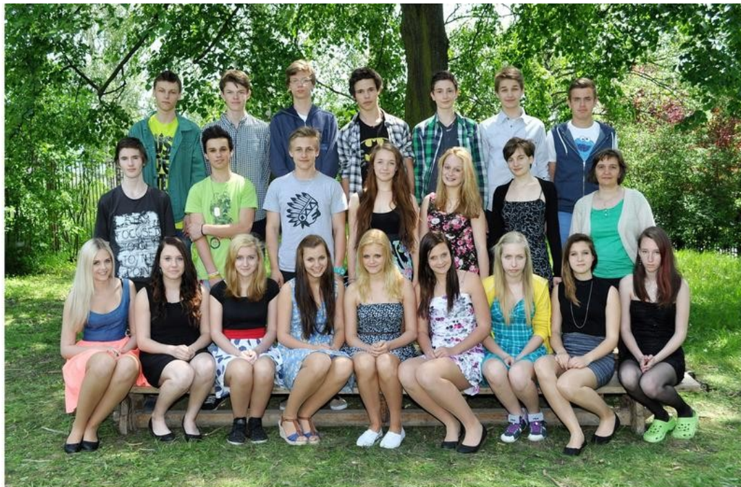
ZŠ Hluchák 2013 - 2014

Ž: Já vím, je to pro nás všechny těžké a moc se ti omlouváme. Nechci se s tebou rozejít ve zlém! Ale .. (refrén písničky Queen I want to break free).